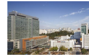
서울성모병원(1,375병상) 서울시 서초구 반포대로 222

8개 병원 총 6,440여 병상의 가톨릭대학교 부속병원은 국내 간호대학 중 최고의 실습 환경을 자랑합니다.