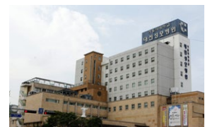
대전성모병원(663병상) 대전시 중구 대흥로 64