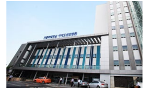
여의도성모병원(537병상) 서울시 영등포구 63로 10