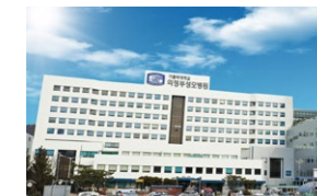
의정부성모병원(689병상) 경기도 의정부시 천보로 271