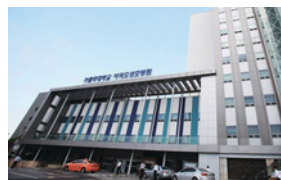
여의도성모병원(535병상) 서울시 영등포구 63로 10