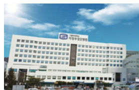
의정부성모병원(681병상) 경기도 의정부시 천보로 271