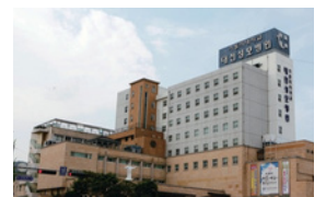
대전성모병원(663병상) 대전시 중구 대흥로 64