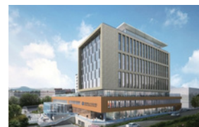
부천성모병원(662병상) 경기도 부천시 원미구 소사로 327